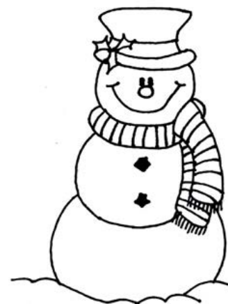
Planșe de colorat